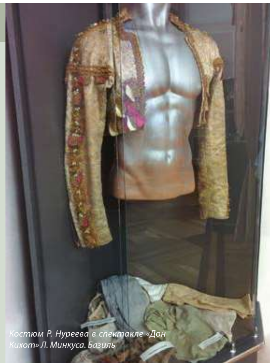
Костюм Р. Нуреева в спектакле «Дон Кихот» Л. Минкуса. Базиль

В 2009 году музей «Р. Нуреев» получил грант Главы Республики Башкортостан.